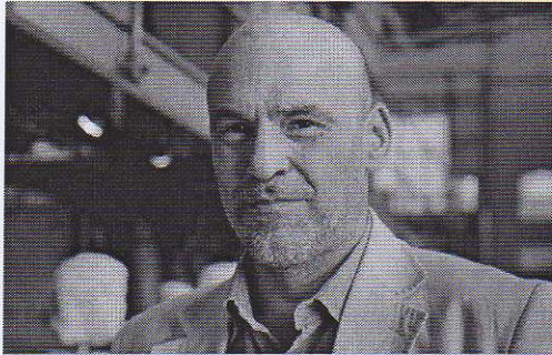
Giordano Bruno Guerri

Sarà Giordano Bruno Guerri, con il saggio Il sangue del sud. Antistoria del Risorgimento e del brigantaggio (Mondadori), l'ospite del sesto appuntamento del Premio e rassegna letteraria Com&Te Comunicazione, giornalismo e dintorni, che si terrà mercoledì 15 giugno prossimo, alle ore 18.30, nel Salone delle feste del Social Tennis Club di Cava de'Tirreni. La rassegna, giunta alla V edizione, è organizzata dall'associazione Comunicazione & Territorio. Altro che banditi incivili e incolti: i briganti che si opposero alle truppe savoiarde erano patrioti ribelli, contadini esasperati