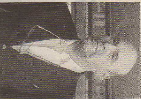
Il giornalista e scrittore Giordano Bruno Guerri

Sarà il giornalista e scrittore Giordano Bruno Guerri, presidente della Fondazione Vittoriale, con il saggio «Il sangue dei sud. Antistoria del Risorgimento e del brigantaggio» (Mondadori), l'ospite del sesto appuntamento del premio e rassegna letteraria